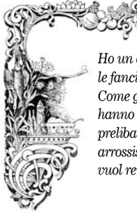
Salvador Dalí "La droga sono io"